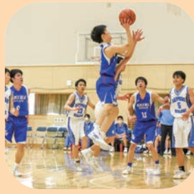
男子バスケットボール