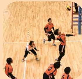
女子バレーボール