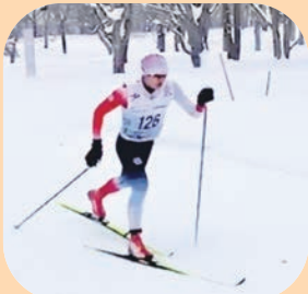
クロスカントリースキー