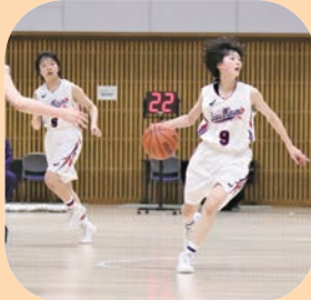
女子バスケットボール