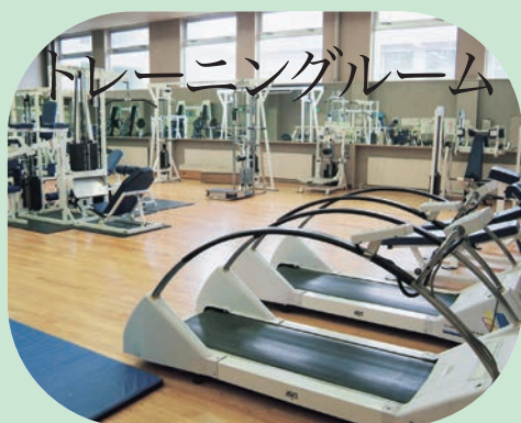
トレーニングルーム