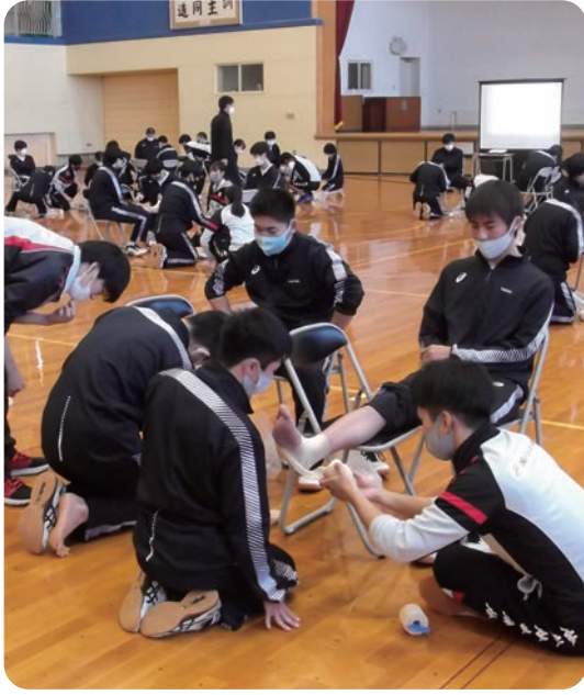
テーピング実習風景