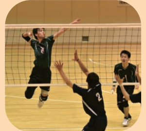
男子バレーボール