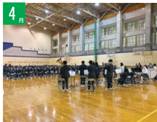
生徒会オリエンテーション